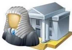
Суд общей юрисдикции, мировые судьи